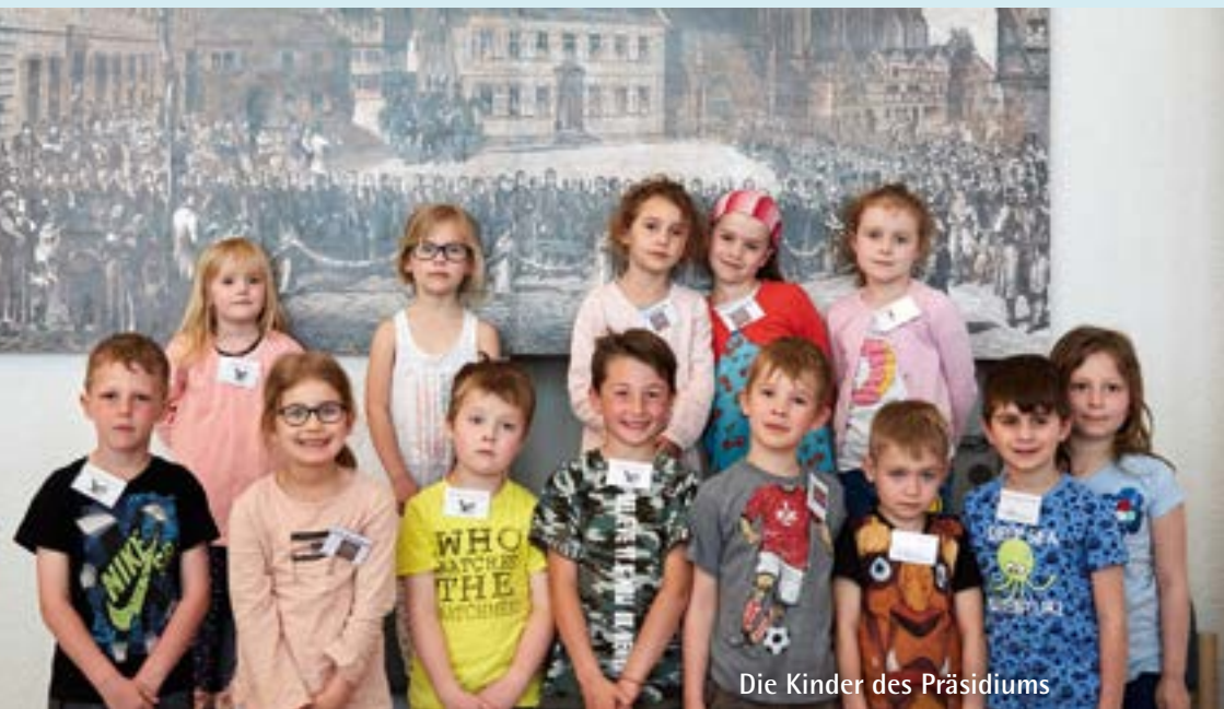
Die Kinder des Präsidiums