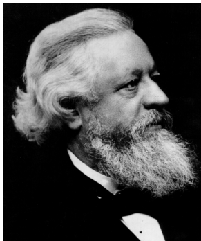
Felix Alexandre Guilmant